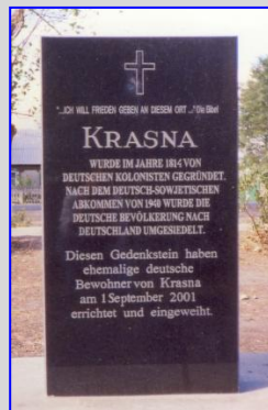
Kapelle u. Gedenkstein