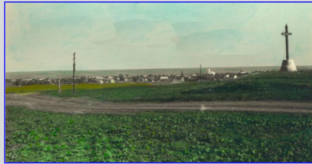
Blick auf Krasna vom Antschiokraker Weg aus