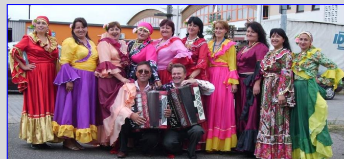
Folkloregruppe Krasnoe, 2007 in Urmitz/Rh.