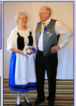
Bessarabische Tracht der Sing- und Tanzgruppe Rheinland-Pfalz