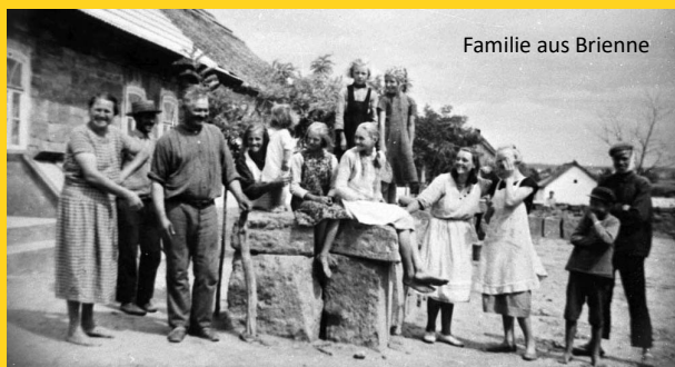
Familie aus Brienne

KLEINGRUPPENARBEIT »Welche Erfahrungen haben wir anlässlich dieser Erlebnisse in unseren Familien gemacht?«