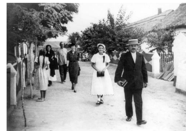
Kirchgang in Teplitz