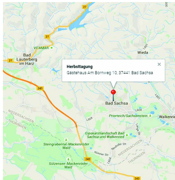
Detailansicht Bad Sachsa

Mit der DB: Bahnhof Bad Sachsa – Taxi zum Gästehaus vorher bestellen, Tel. Nr. 05523 - 2400