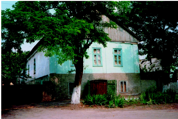
Tarutino: Hof ehem. Friedrich/Döhring 1991 (Katja Döhring)

Insbesondere gilt an die ältere Generation der Aufruf: Bringt eure Enkel und Urenkel mit, damit unsere Geschichte durch die Kinder weiterleben kann!