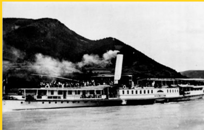
Aussiedlerschiff auf der Donau

ALLEN TEILNEHMERN wünschen wir eine gute Anreise und am Tage der Veranstaltung viele gute Begegnungen.